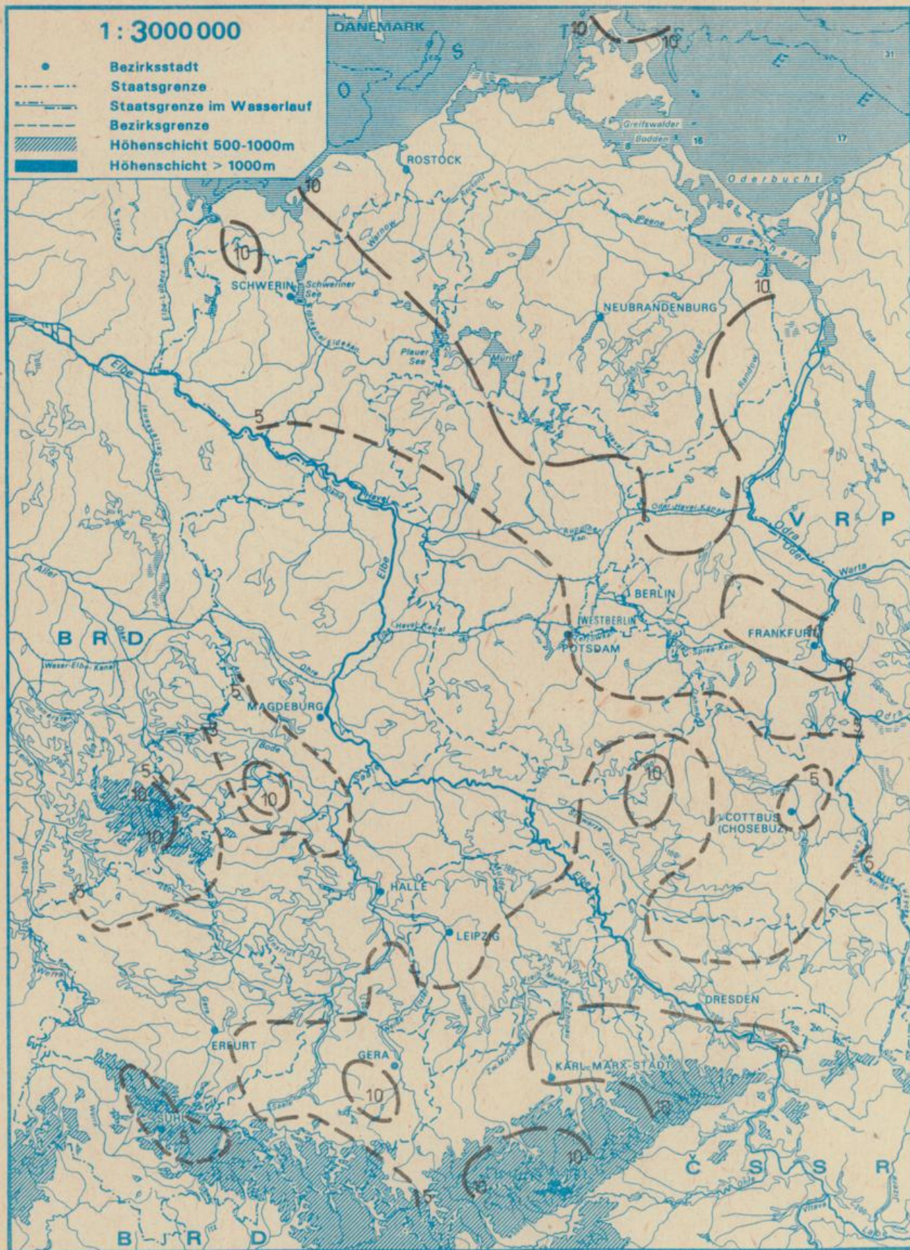
Dekadensumme der Niederschlagshöhe in mm 1. Novemberdekade 1988