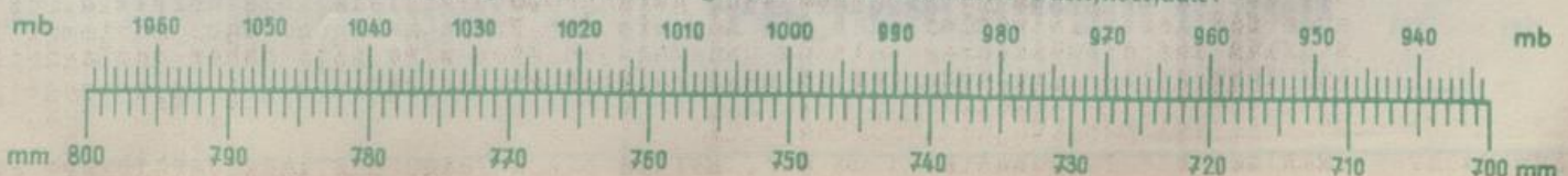
Umrechnung des Luftdruckmaßes Millibar in Millimeter Quecksilbersäule:

Der vorliegende Wetterbericht enthält auf Seite 2 weitere regelmäßige Beobachtungsdaten, deren Bedeutung aus den vorgedruckten Tabellenüberschriften ohne weiteres verständlich ist. An Beobachtungen aus der freien Atmosphäre werden täglich eine Höhenwindmessung von Dresden und die Messergebnisse (Luftdruck, Temperatur und relative Feuchtigkeit) einer deutschen aerologischen Aufstiegsstelle veröffentlicht. Die bioklimatische Bedeutung der Messungen des Observatoriums Wahnsdorf b. Dresden wird durch regelmäßig wiederholte Abhandlungen auf Seite 4 des Wetterberichtes erläutert.