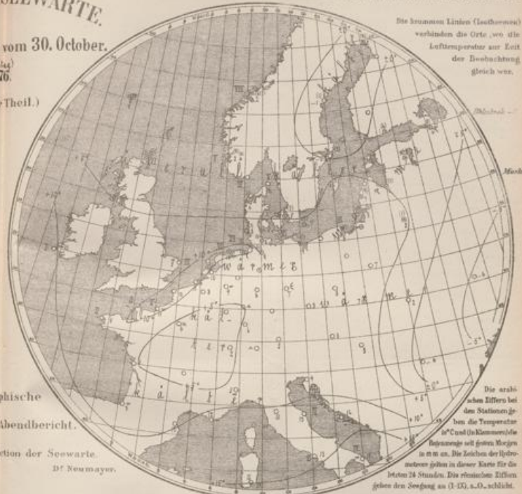
II. Geographische Übersicht & Abendbericht.

Die horizontalen Linien (Isothermen) verbinden die Orte, wo die Lufttemperatur zur Zeit der Beobachtung gleich war.