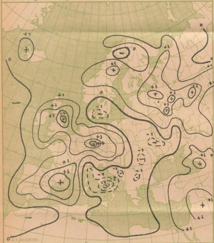
Temperaturkarte vom 8.1. 1948 06.00 Uhr MGZ