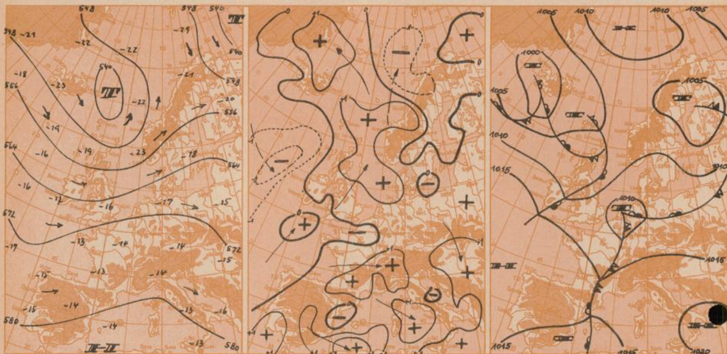
Vorhersagekarte für Montag, 4. Juli 1966 7 Uhr