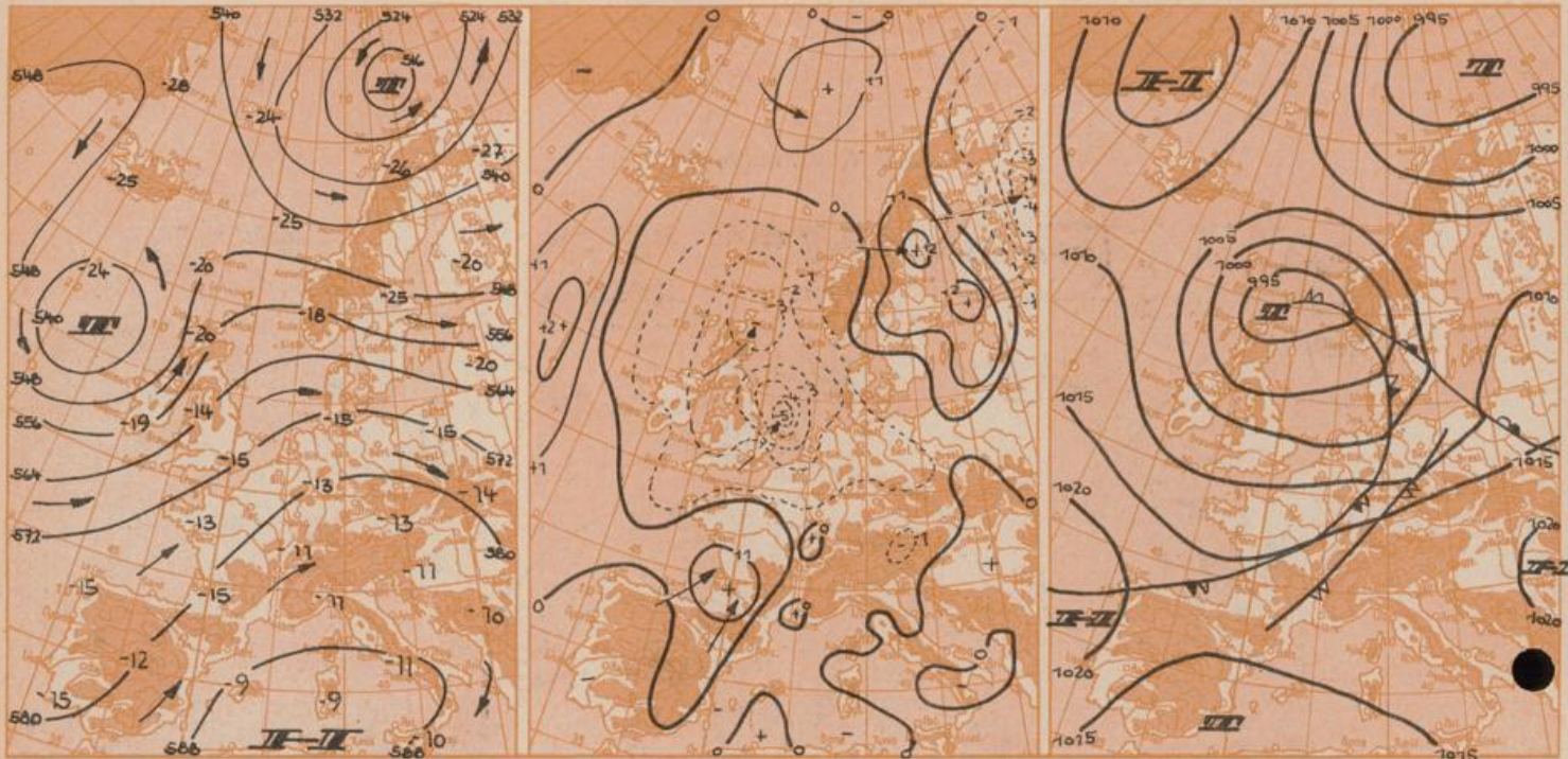
Maßstab 1, 5000000

Vorhersagekarte für Dienstag, 13. Sept. 1966 7 Uhr