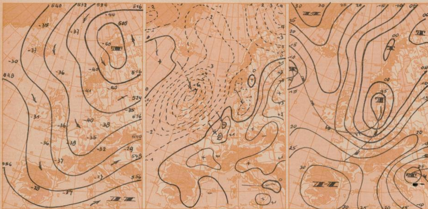
Maßstab 1 : 5000000

Vorhersagekarte für Mittwoch, 24. November 1965 7 Uhr