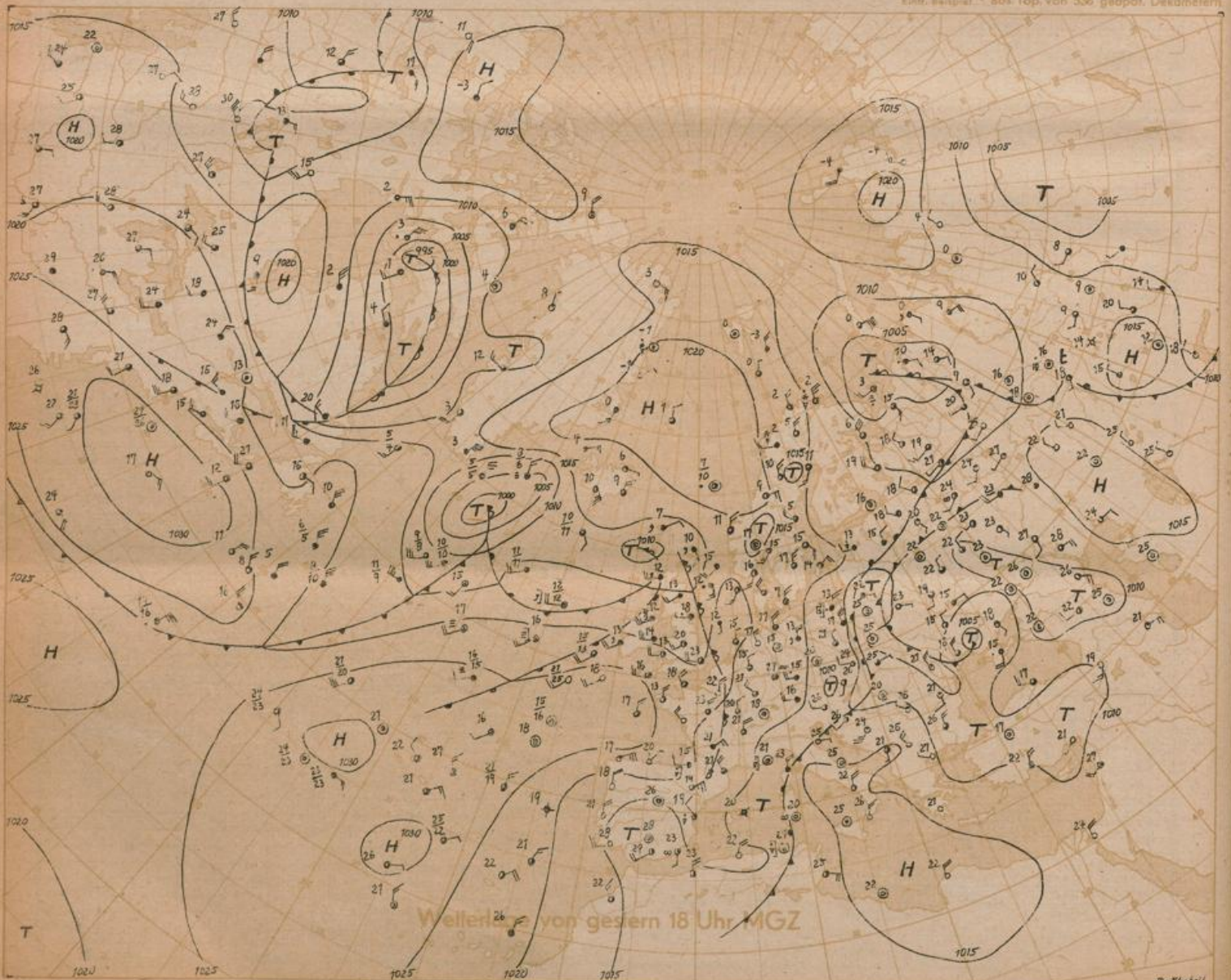
Wetterlage von gestern 18 Uhr MGZ

in 500 mb -33°C etwa 20% Feuchte in 5 oder 6 km Höhe West 75 Knoten Einfl. Beispiel