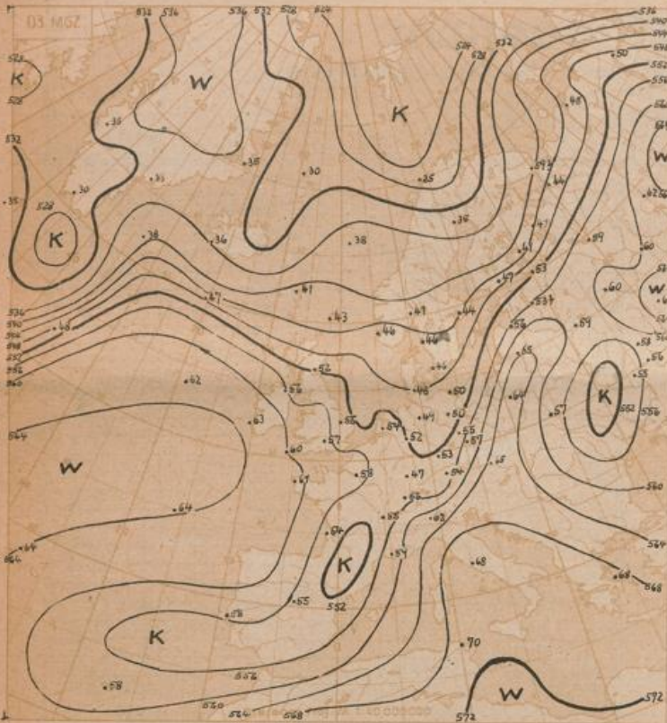
Relative Topographie 500 über 1000 mb (geopot. Dekameter) 11-29.6. Dekadenmittel Hamburg (1935-44) 552 geopot. fm