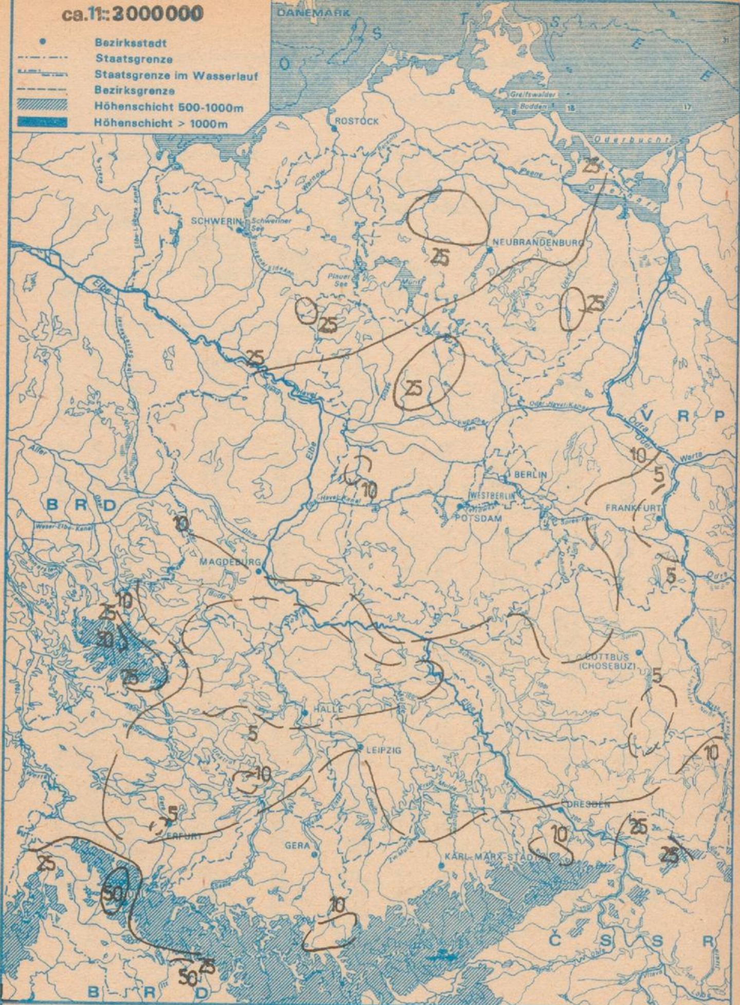
Verteilung der Niederschläge Dekadensummen [mm]