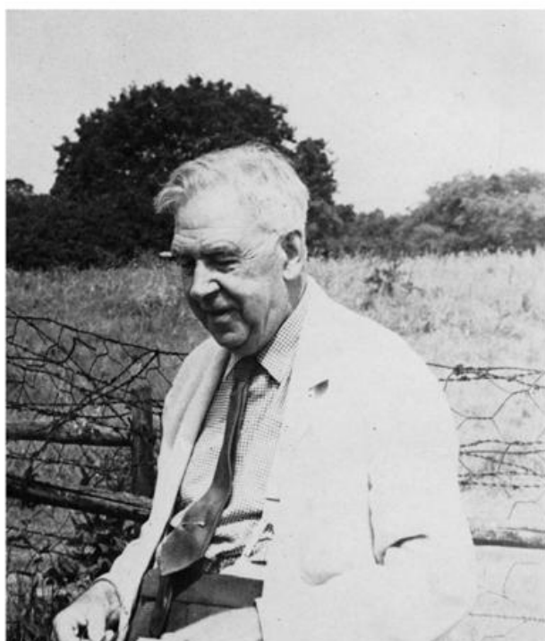
Foto 1: Prof. Dobson

Vor 30 Jahren, am 10. März 1976, starb im Alter von 87 Jahren in Oxford einer der Pioniere der Stratosphären- und speziell Ozonforschung, Prof. Dr. Gordon Miller Boume Dobson (Foto 1). Mit seinem Namen verbunden ist seit nunmehr 80 Jahren das von ihm entwickelte Dobson Ozon-Spektrophotometer. 1924 baute er die Urversion des Dobsons als sogenannten Spektrographen, der auf der Basis von Fotoplatten arbeitete. Jedes einzelne, fotografisch festgehaltene UV-Spektrum wurde damals fotoelektrisch vermessen und daraus die Ozonschichtdicke bestimmt. Erste intensive Messungen der Ozonschicht machte er 1925 in Robin Wood, Boars Hill, wo sich sein Haus mit Werkstatt und Laboratorium befand. Bemerkenswert ist, dass schon damals die Wechselwirkungen zwischen Ozonschichtdicke und meteorologischen Bedingungen inklusive des Jahresganges festgestellt wurden.