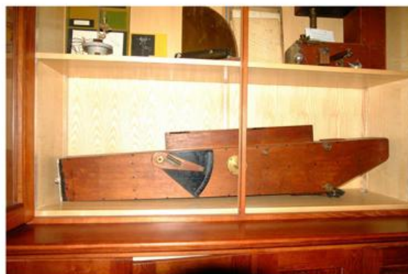
Foto 2 zeigt einen der Ur-Dobsons, ausgestellt im Dobson-Room der Oxford University, aus dem Internet unter: www-atm.physics.ox.ac.uk/main/dept/dobson.html

Daher beschloss Dobson mit fünf weiteren Spektrographen, die im Winter 1925/26 gebaut wurden, ein Messnetz aufzuziehen. Zu diesen ersten Stationen gehörte 1926 neben Oxford, Valentia, Lerwick, Abisko und Lindenberg auch Arosa (Schweiz). Dort wird nun seit 80 Jahren ununterbrochen die Dicke der Ozonschicht überwacht. Die Weiterentwicklung des Ur-Dobsons (s. Foto 2) mit integrierter fotoelektrischer Messung des Spektrums wurde ab 1928 von der Londoner Firma Beck-Ealing mit Unterbrechungen bis in die 90er Jahre gebaut. Etwa 130 Exemplare wurden hergestellt, wobei es sich Prof. Dobson zu Lebzei-