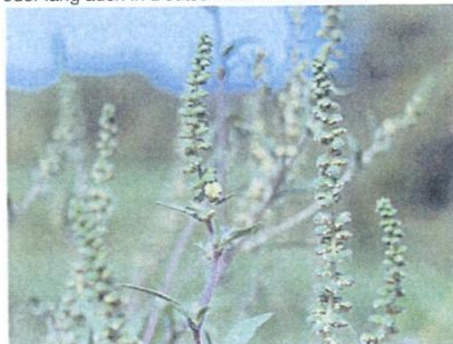
Traubenkraut – eine ernste Gefahr für die Allergiker. Ihre Ähnlichkeit mit Beifuss ist nicht zu verkennen.

Der Pollen kann bei Allergikern sehr starke Allergien, sprich Asthma-Anfälle auslösen. In Amerika stellt diese Art ein großes Problem dar, deshalb soll sie sofort in das phänologische SOFORTmeldeprogramm aufgenommen werden, wenn sie sich in Deutschland ausbreitet. Von Ungarn aus hat sie schon unsere Nachbarländer Österreich und die Schweiz erreicht, es ist deshalb zu erwarten, dass das Traubenkraut über kurz oder lang auch in Deutschland entdeckt wird.