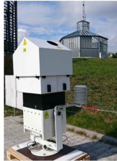
Abb.2: DIAL-Prototyp während der Erprobung am MOL-RAO in 2015.

pulse, deren dichtbenachbarte Wellenlängen unterschiedlich stark von Wassermolekülen absorbiert werden. Das Messverfahren ist prinzipiell selbstkalibrierend. Der Prototyp (Abbildung 2) eines für den operationellen Betrieb ausgelegten Gerätetyps wurde bereits in 2015 für die Dauer eines Monats am MOL-RAO erprobt. Abbildung 3a zeigt an einem Fallbeispiel die Wasserdampfmessungen des DIALs und des Forschungs-Raman-Lidars „RAMSES“. Die sehr gute Vergleichbarkeit der Erfassung des zeitlichen Verlaufs und der Höhenzuordnungen von Wasserdampfstrukturen zeigt das Potenzial des DIALs.