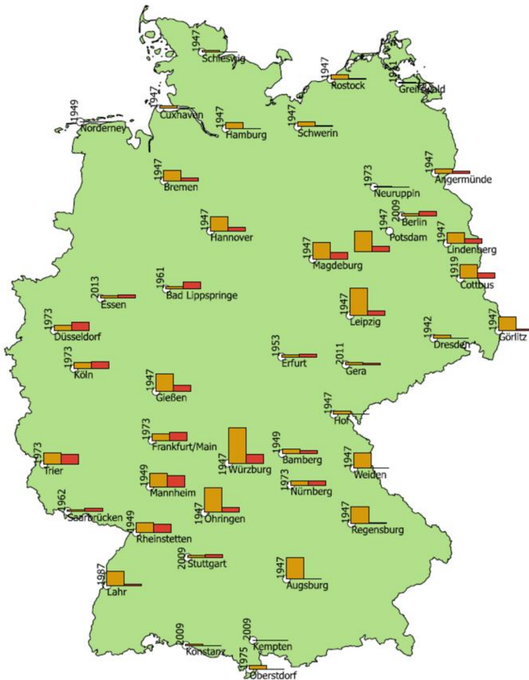
Abbildung 2: Kumulative Summe der maximalen Tagestemperatur über 30°C für das bisherige Maximum (links) und das Jahr 2016 (rechts) für den Monat September für Stationen mit Messbeginn vor 1981.

Abbildung 2 zeigt die kumulative Summe der maximalen Tagestemperatur über 30 °C für den Monat September. Das heißt je länger eine Hitzeperiode in einem September stattgefunden hat und je intensiver (d.h. je wärmer) sie war, desto höher ist der dargestellte Balken. Der linke Balken steht für das bisherige Maximum der kumulativen Summe und der rechte Balken für das Jahr 2016. Als Beschriftung ist sowohl der Stationsname eingebildet, als auch das Jahr des bisherigen Maximums. Berücksichtigt wurden Stationen, die seit mindes-