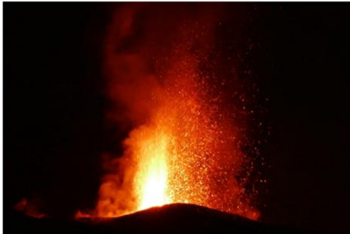
Abbildung 2 Vulkanausbruch auf La Réunion am 20. Mai 2015.

Ein besonderes Naturschauspiel hat die Kampagne extra aufregend und interessant gemacht: die Aschewolke vom Ausbruch des Vulkans Calbuco in Chile vom 22. April erreichte am ersten Messtag die Insel La Réunion. Diese „Wolke“ war in den Lidar-Daten deutlich sichtbar. Um dieses Phänomen zu beobachten, wurden zusätzliche COBALD-Aufstiege durchgeführt. Sie zeigen sehr gut die Evolution der Aschewolke und die Zunahme von deren vertikaler Mächtigkeit von einigen hundert Metern bis auf mehrere Kilometer.