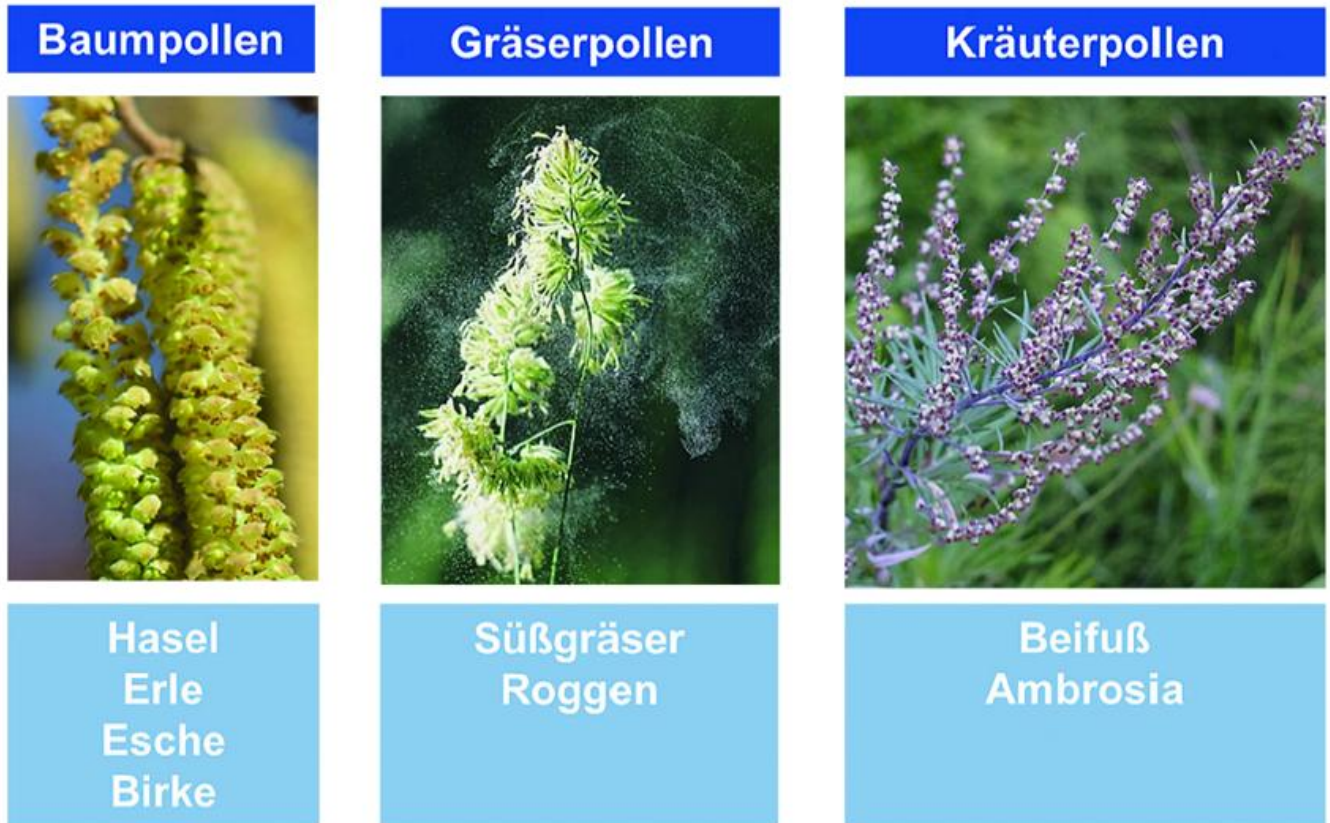
Abb. 6: Einteilung der acht allergologisch wichtigsten Pollenarten

nicht nur sehr unscheinbar, sondern in einem homogenen Bestand nur wenige Tage am Stäuben. Hier ist eine hohe Aufmerksamkeit hinsichtlich der Beobachtung des Blühbeginns gefragt.