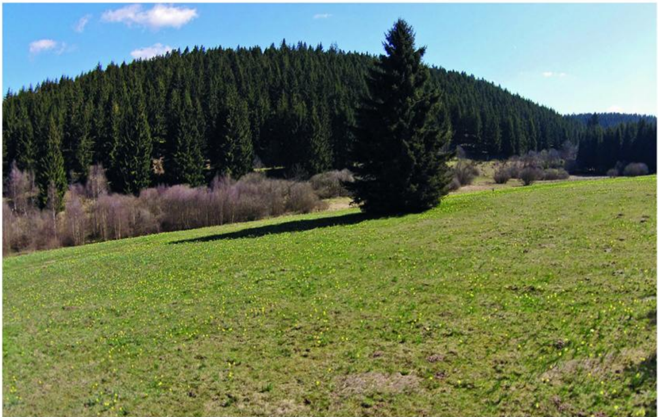
Abb. 1: Narzissenblüte in der Nordeifel