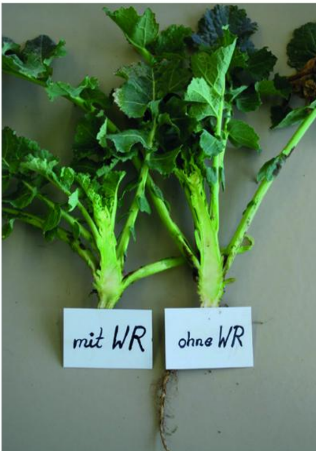
Bild 7: Querschnitt mit / ohne Regulator vom 10.03.2021

In einer Gegenüberstellung der Pflanzen wird schon verständlich, welchen Einfluss der Regulator auf das Pflanzenwachstum hat (Bild 5; Gegenüberstellung der Stichproben vom 02.03.2021). Auf den ersten Blick ist der Größenunterschied erkennbar. Rechts die kleineren Pflanzen mit Wachstumsregulator und links die größere unbehandelte Wintertraps. Auch in der Gegenüberstellung vom 10.03.2021 ist der Größenunterschied sichtbar (Bild 6; Gegenüberstellung vom 10.03.2021). Beim Durchschneiden der Probenpflanzen wird deutlich wie abweichend das Längenwachstum voranschreitet (Bild 7; Querschnitt mit / ohne Regulator