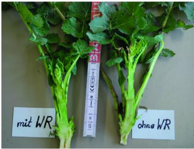
Bild 9: Querschnitt mit / ohne Regulator vom 23.03.2021