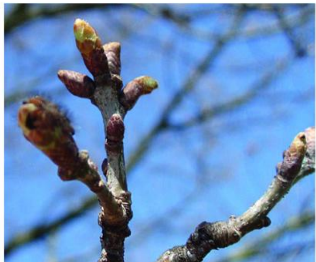
Abb. 7: Beginn des Knospenschwellens, Foto: Halbig

Quelle: Anleitung für die phänologischen Beobachter des Deutschen Wetterdienstes.