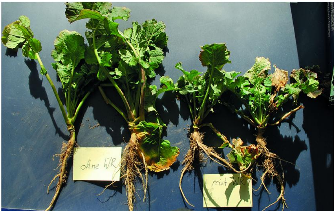
Bild 5: Gegenüberstellung der Stichproben vom 02.03.2021.