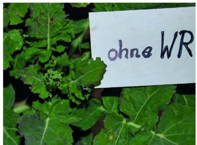
Bild 11: Blütenstand umschlossen ohne Regulator vom 23.03.2021

vom 10.03.2021). Außerdem ist ersichtlich, dass die Knospen des Winterrapses ohne Wachstumsregulator weiter oben liegen. Wenige Tage später wird der Abstand der beiden Knospen geringer (Bild 8; Querschnitt mit / ohne Regulator vom 16.03.2021 und Bild 9; Querschnitt mit / ohne Regulator vom 23.03.2021). Bei einer Betrachtung von oben wird ein Unterschied zwischen den beiden Anbauarten nicht offenkundig. Der Blütenstand ist jeweils noch von Blättern umschlossen (Bild 10; Blütenstand umschlossen mit Regulator vom 23.03.2021 und Bild 11; Blütenstand umschlossen ohne Regulator vom 23.03.2021).