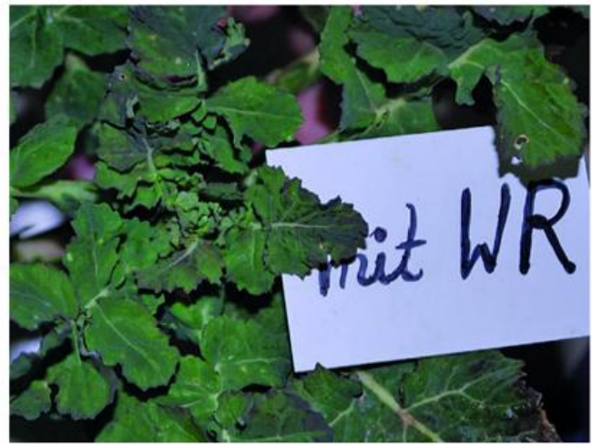
Bild 10: Blütenstand umschlossen mit Regulator vom 23.03.2021

vom 10.03.2021). Außerdem ist ersichtlich, dass die Knospen des Winterrapses ohne Wachstumsregulator weiter oben liegen. Wenige Tage später wird der Abstand der beiden Knospen geringer (Bild 8; Querschnitt mit / ohne Regulator vom 16.03.2021 und Bild 9; Querschnitt mit / ohne Regulator vom 23.03.2021). Bei einer Betrachtung von oben wird ein Unterschied zwischen den beiden Anbauarten nicht offenkundig. Der Blütenstand ist jeweils noch von Blättern umschlossen (Bild 10; Blütenstand umschlossen mit Regulator vom 23.03.2021 und Bild 11; Blütenstand umschlossen ohne Regulator vom 23.03.2021).