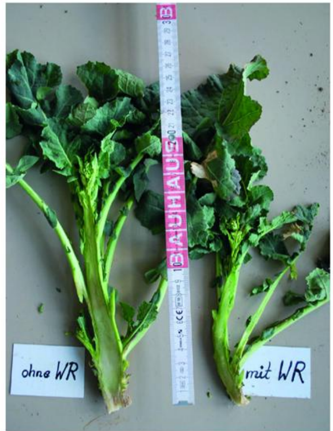
Bild 12: Querschnitt mit / ohne Regulator vom 26.03.2021

Die Fotos zeigen den großen Einfluss des Wachstumsregulators auf die Entwicklung des Winterraps, dies wird auch in der „Anleitung für die phänologischen Beobachter des Deutschen Wetterdienstes“ beschrieben sowie die unterschiedlichen Entwicklungsphasen des Winterraps.