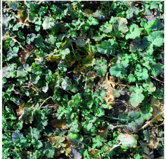
Bild 3/4: Winterraps ohne Regulator vom 24.02.2021