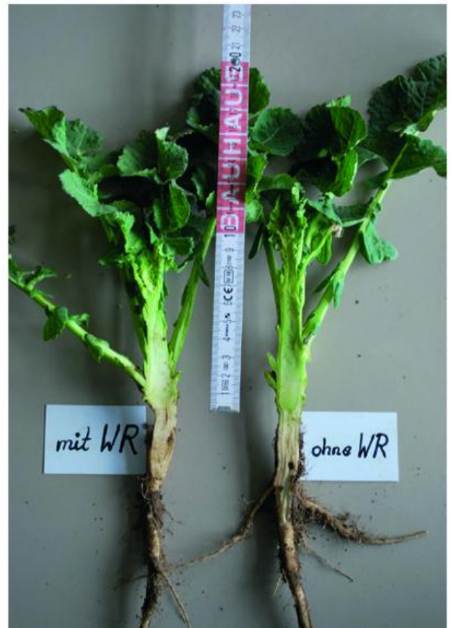
Bild 8: Querschnitt mit / ohne Regulator vom 16.03.2021