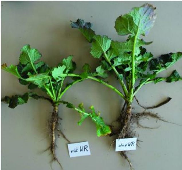
Bild 6: Gegenüberstellung vom 10.03.2021

Am ZAMF (Zentrum für Agrarmeteorologische Forschung) in Braunschweig haben wir zur Untersuchung und Erklärung dieser Thematik eines unserer Versuchsfelder mit Wintertraps bestellt,