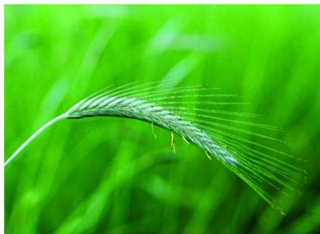
Abb. 5: Roggenblüte

Roggen gilt als hochallergen, wird allerdings in Deutschland nicht überall flächendeckend angebaut. Außerdem sind die winzig kleinen Blüten