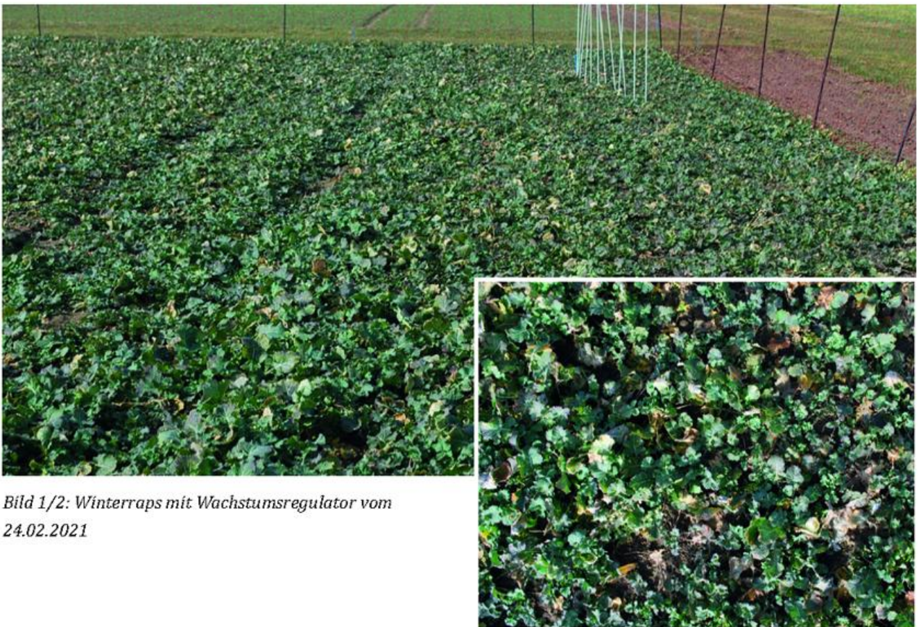
Bild 1/2: Winterraps mit Wachstumsregulator vom 24.02.2021

Um nun die Rapspflanzen insgesamt in einem weniger auswinterungsgefährdeten Stadium zu halten und die Toleranz gegenüber Frösten insgesamt zu erhöhen, können im Herbst wachstumsregulierende Mittel eingesetzt werden. Hierdurch werden die Abstände zwischen den Internodien verkürzt. Zusätzlich kann durch die verminderte Neigung zum Strecken der Pflanze die Anlage von Seitentrieben gefördert werden, so dass relativ gleichmäßige Bestände entstehen.