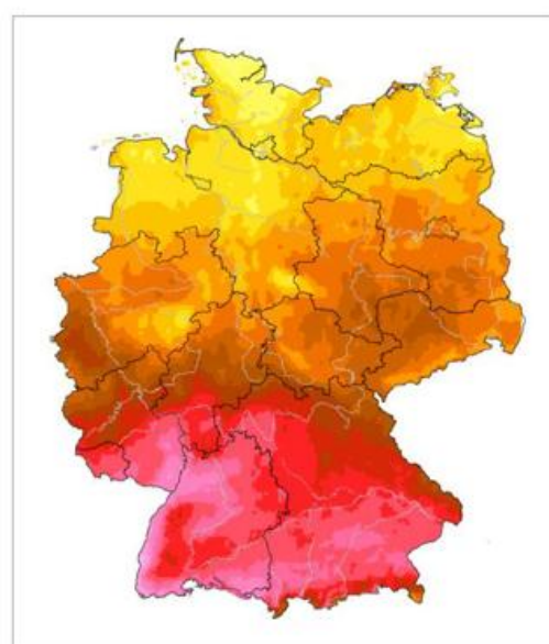
Fig. 1b: Annual sum of global radiation [kWhm -2 ] in 2003 over Germany, derived from the TRY basis data set, doi:10.5676/DWD_CDC/TRY Basis v001

The gridded dataset has a spatial resolution of 1 km 2 and covers the period 1995-2012. Besides hourly data, also grids of daily and monthly means of are also