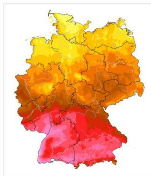
Abb. 1b: Jahressumme der Globalstrahlung [kWhm -2 ] für 2003 über Deutschland, aus dem TRY-Basisdatensatz abgeleitet, doi:10.5676/DWD_CDC/TRY Basis v001 .